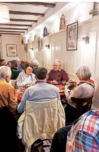
Gesellige Tafelrunde in der «Auberge des Franciscains»

Der anschliessende Verdauungsspaziergang durch die kleine, hübsche Altstadt war daher durchaus angebracht und wohltuend, auch wenn sich die angekündigte Sonne leider nicht so recht zeigen wollte. Immerhin aber war es frühlingshaft mild, trocken und damit ideal für einen gemütlichen Bummel. Ausgangspunkt war der grosse Hauptplatz, die «Place de la Réunion». Er ist umrahmt von farbenfrohen Häusern im Renaissance-Stil