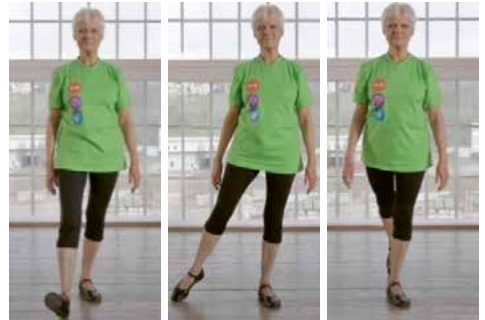
Übung 2 : Verlagern Sie Ihr Gewicht auf ein Bein und tippen Sie mit dem anderen Bein vorne, seitwärts und hinten auf den Boden.