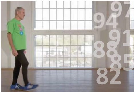
Übung 1 : Gehen Sie auf einer Linie in kleinen Schritten nach vorne und zählen Sie laut in 3er Schritten von 100 rückwärts.

Mit diesen beiden Übungsbeispielen von sichergehen.ch können Sie sofort mit dem Gleichgewichtstraining beginnen. Jede Bewegung ist besser als keine!