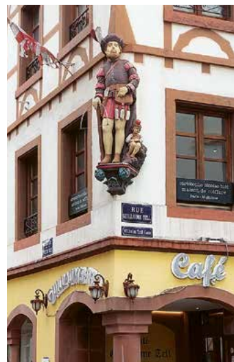
Wilhelm Tell wacht mit Sohn Walter über das Treiben auf dem Hauptplatz