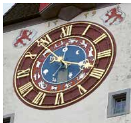
Die astronomische Uhr auf dem Spittelturm, dem Stadttor von Bremgarten, funktioniert auch heute noch bestens.

Die katholischen Bauten im Kirchenbezirk, auch genannt der «kleinen Vatikan», erstrahlt im neuen Glanz, nachdem bei Renovationsarbeiten Ende der 80er Jahre im Dachstock ein Brand mit einem Todesopfer ausgebrochen war. Die verformte Glocke im Vorgarten erinnert noch heute daran. Dieser Bezirk wird auch als «schönster und reichster Kirchenhof des Aargaus» bezeichnet.