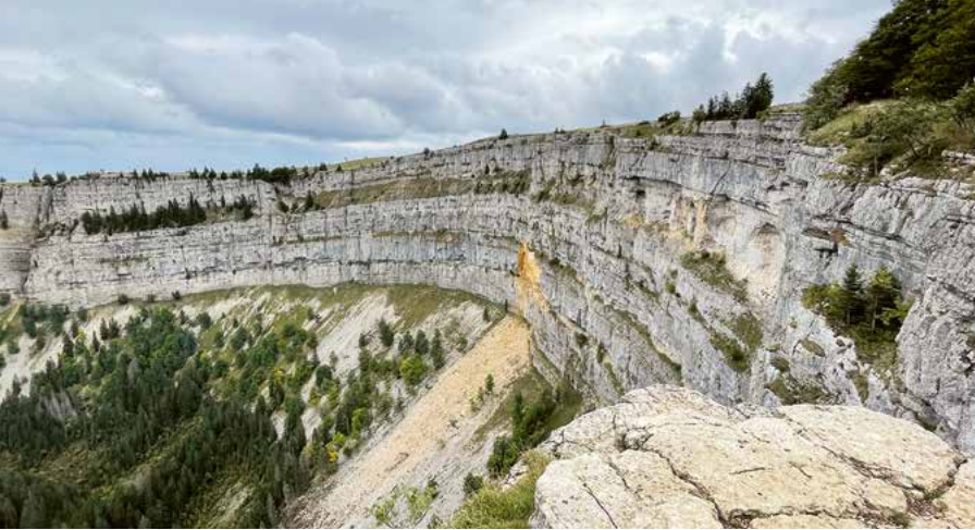
Imposante Naturarena Creux du Van