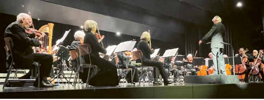
Senioren- orchester Luzern