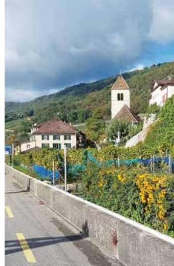
Entlang der Reben am Bielersee (Twann)

Die «grüne Fee», ein begehrtes Souvenir.