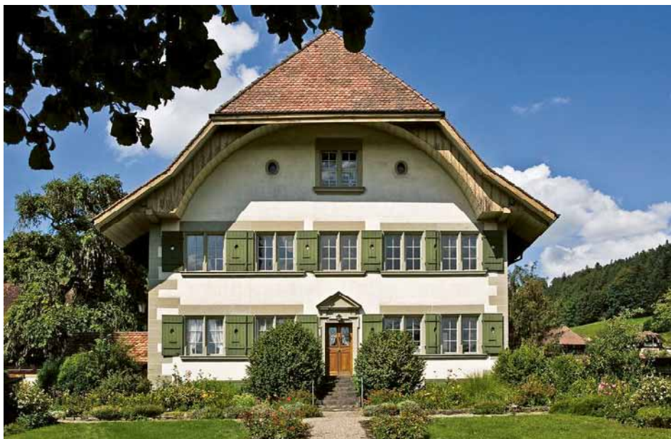
Pfarrhaus des Pfarrers und Schriftstellers Albert Bitzios / Jeremias Gotthelf